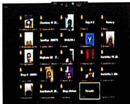
ಆನ್‌ಲೈನ್ ಕಲಿಕೆ: Zoom